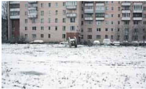
пр. Науки, д. 44