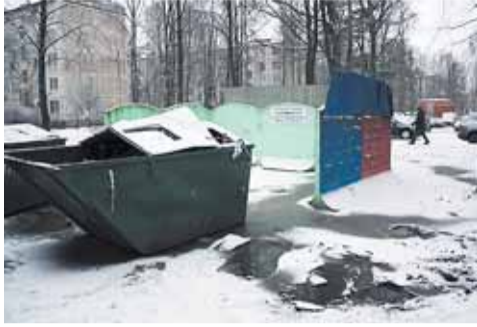
пр. Мечникова, д. 14

Первый адрес был включен в план еженедельного объезда по инициативе УК ООО «ЖКС № 3 Калининского района». По имеющейся информации на «горячую линию» губернатора Санкт-Петербурга поступили многочисленные обращения граждан, проживающих по адресу: ул. Замшина, 72, кв. 81, 86, 90, по вопросу скопления воды на контейнерной площадке, расположенной на пр. Мечникова, 14. Большая лужа образуется на данном участке после сильных осадков, а также в результате таяния снега с наступлением оттепели. Всему виной сильный уклон в сторону Бестужевской улицы. Вода скапливается и не уходит. Выездная комиссия, осмотрев участок, пришла к заключению, что подход к контейнерной площадке необходимо отремонтировать. Его включают в адресную