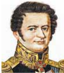
Генерал Александр Дмитриевич Засядько

Фактором успешной научной деятельности учебного заведения в XIX – начале XX веков являлась его тесная связь с казенными военными заводами, квалифицированный преподавательский состав, учебные программы, отличительной особенностью которых являлся акцент на глубокие математические знания обучающихся. Несомненный успех проекта артиллерийского училища и академии был обусловлен и выбором места дислокации вуза. Его учебные аудитории и лаборатории были расположены в так называемом «артиллерийском уголке» Петербурга. В районе Литейного проспекта и Симбирской улицы (ранее – Бочарной, ныне – Комсомола), а также ближайших окрестностях города компактно располагались полностью или частично все элементы инфраструктуры Артиллерийского ведомства: органы во-