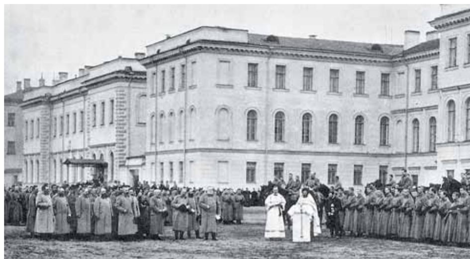
Михайловская артиллерийская академия

В России и за рубежом широко известны имена ряда крупных ученых и педагогов учебного заведения. Роль первой скрипки во вновь созданном учебном заведении по формальному положению и талантам играл первый управляющий учебной бригадой и училищем генерал А.Д. Засядько (1779–1837). Это была легендарная личность, один из немногих в ту эпоху полковников – кавалеров ордена Святого Георгия 3-й степени. В XIX веке в училище и академии работали выдающиеся математики М.В. Остроградский и П.Л. Чебышев, физик